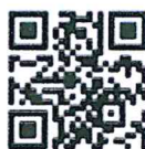
สำหรับระบบ ios